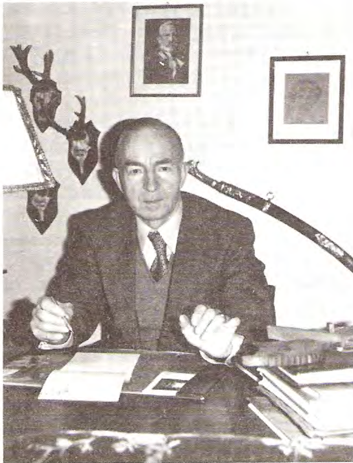
Plukovník Friedrich-Wilhelm von Notz v roce 1978.