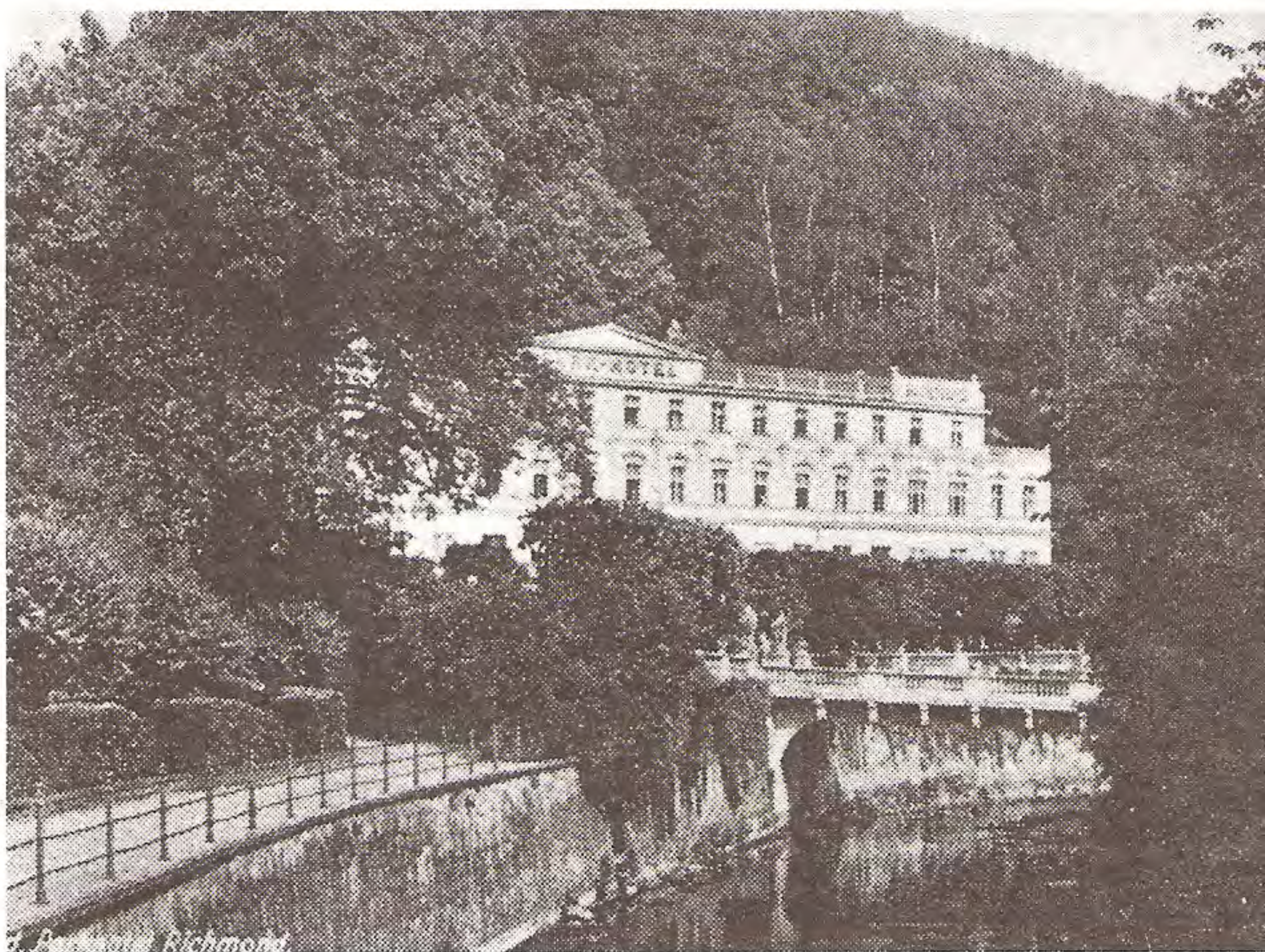
Richmond — hotel, Karlovy Vary, sídlo KONR.